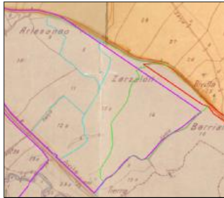
Fig. 2. Ubicación de las parcelas 8, 12 y 13 permutadas y parcela 14 adquirida por donación

Así mismo, según las escrituras obrantes en el Inventario de Bienes de la Excm. Diputación Provincial de Ávila, el 18 de junio de 1948 se formalizó, ante el notario D. Pedro Manuel Casado Guío, escritura de permuta de terrenos propiedad de D. Victoriano Pindado Úbeda y terrenos propiedad de la Excm. Diputación Provincial de Ávila; de tal forma que en dicha escritura se pone de manifiesto que, entre otras, fueron permutadas las parcelas 8, 12, y 13 del polígono 27, pasando a ser dichas parcelas propiedad de la Excm. Diputación Provincial de Ávila.