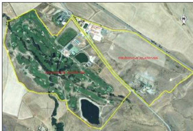
Fig. 2. Levantamiento topográfico y subdivisión de la finca "Dehesa del Fresnillo" en Polígonos

Las parcelas catastrales que conforman el Polígono A son las siguientes: