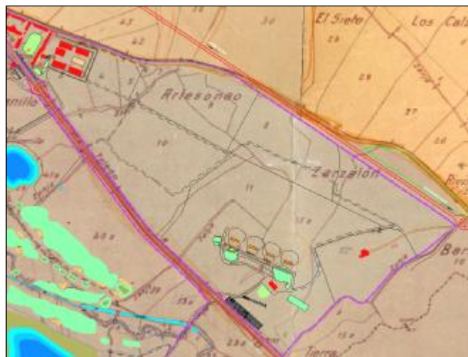
Fig. 3. Georreferenciación de infraestructuras existentes con respecto a la Cartografía histórica

Al objeto de clarificar la ubicación de las parcelas anteriormente descritas, se procede a georreferenciar las infraestructuras existentes dentro de la finca de "El Fresnillo" y la cartografía histórica de la zona.